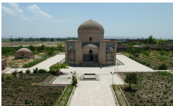
تصویر شماره ۱: آرامگاه شیخ امین الدین جبرائیل

نگاره‌های دیواری، نقوش موجودات دنیوی و اخروی مثل خروس، طاووس و مرغان بهشتی با رنگ‌بندی‌های روح‌نواز و طرح‌های اسلیمی و مهمتر از این‌ها اجرای گنبدی بزرگ به تقلید از طاق عرش بر بالای اتاق اصلی هشت ضلعی مقبره و از طرفی دیگر استفاده گسترده از نام مقدس علی(ع) در کنار اسماء مقدس الله و محمد در کتیبه‌های نمای سطوح خارجی بنا و کتیبه نواری داخلی و اتاق مقبره که مشتمل بر آیات سوره فتح و فرمایش‌های امیرالمؤمنان حضرت علی(ع) رهبر شیعیان و راهنمای بحق تصوف و سایر کتیبه‌ها و اشعار فارسی در واقع سعی بر این شده تا با تلفیق زندگی دنیوی و اخروی انسان‌ها یک هدف عمده و اصلی و آن هم تبیین عقلانی در تجلی عرفان و روحانیت بخشی بر فضای آن جایگاه مقدس و اشاعه عرفان و تصوف و تشیع نه تنها در منطقه، بلکه در کل ایران اسلامی را دنبال کنند. با توجه به آنچه گفته شد پاسخ سوال ما در اینجا محرز می‌شود که با دیدن بنای بقعه شیخ امین الدین جبرائیل که در آن هنرمندان از اشکال عناصر اصلی حیات بشری الهام گرفته و در تزینات آن از متون قرآنی و احادیث و خطوط اسلامی استفاده کرده‌اند و فضای معنوی و عرفانی به وجود آورده و در واقع تأثیرات عرفان و حکمت اسلامی در ساختار معماری و عناصر جنبی آن کاملاً مشهود شده است، این بنا هم در زمان ایجاد و هم امروزه همواره مورد توجه بوده و در تجلی عرفان و تصوف مدخلیت داشته است.