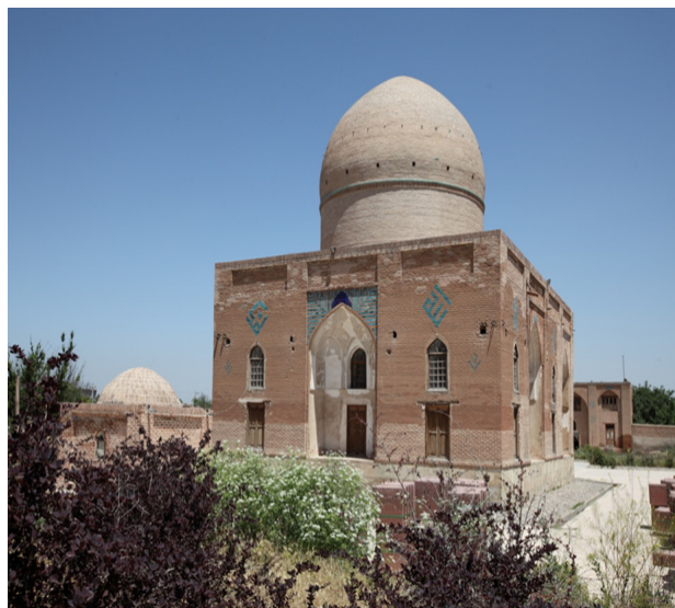
تصویر شماره ۲: کتیبه‌های اسماء مقدس در سطوح بیرونی