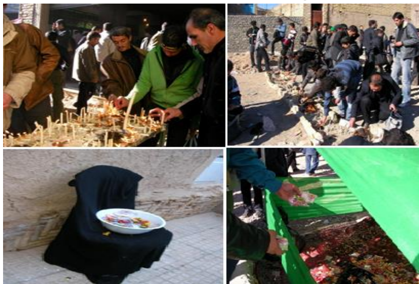
شکل ۱- جلوه‌هایی از مراسم چهل و یک منبری در شهرضا

اولین منبر -امامزاده شاهرضا- به عنوان مقدس‌ترین مکان برای مردم شهرضا می‌باشد. در قدیم این امامزاده در محدوده بیرون شهر قرار داشته است که ساکنین اطراف آن روستایی به نام شاهرضا را تشکیل می‌دادند. امروز با گسترش شهر امامزاده شاهرضا در ورودی شهر از سمت اصفهان قرار گرفته است. عده‌ای این امامزاده را «محمدرضا بن زید بن امام حسن مجتبی (ع)» دانسته و عده‌ای دیگر او را فرزند «امام موسی بن جعفر (ع)» معرفی کرده‌اند (رک: دایره المعارف تشیع، ذیل امامزاده شاهرضا: ۲/۴۴۸ و حاجی قاسمی، ۱۳۸۹: ۱/۷۴).