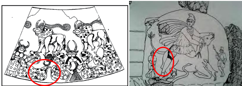
تصویر ۱، نقش برجسته مهرابه، نقش عقرب همراه میترا ر صحنه گاو کشی مقدس، (ورمازرن، ۱۳۸۳)

مخروطی از جنس سنگ صابون وجود دارد که با اسطوره میترا هم‌خوانی دارد (تصویر ۲). نقوش در دو بخش فوقانی و تحتانی قرار گرفته‌اند در بخش تحتانی تصویر دو پیکره شاخ-دار در حال نبرد با مار دیده می‌شود. در قسمت بالای ظرف نقش دو گاو دیده می‌شود که درست در زیر شکم آن‌ها نقش یک عقرب است. موجود شاخ‌دار سمت راست که به نظر اهریمن است چنگال‌هایی شبیه عقرب دارد که در زیر شکم گاو، قرار گرفته‌است. ورمازرن ۴ ، در مورد اهریمن، مار و عقرب چنین می‌گوید: «اهریمن می‌خواست بدی بکند، میترا بدی را به رهایی بشریت تبدیل کرد و خود را نجات دهنده خواند. محتمل است بقایای این اسطوره، که اهریمن به گاوی حمله کرده، در نقوش عقربی که بیضه گاو را در چنگال خود می‌فشارد، بازمانده باشد. عقرب با چنگ زدن به بیضه گاو می‌خواهد منی، یعنی منبع زاینده‌گی و حیات را از بُن درآورد. در اساطیر یونان، مار نماد زمین است. از مکیدن خون گاو، مار یعنی زمین تمایل خود را به آبستن شدن و خیر بشریت را فراهم کردن، آشکار می‌کند» (ورمازرن: ۸۳-۸۴) نبرد اهریمن و وجود گاو، عقرب و مار روی تُنگ جیرفت، می‌تواند فرضیه نشانه‌هایی از آیین میترا را محتمل کند.