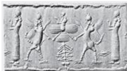
تصویر ۴، مهر استوانه‌ای با نقش عقرب-انسان دوره آشور جدید (خسروی، ۱۳۸۸)