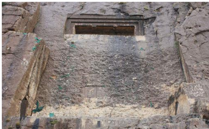
تصویر ۱. گوردخمه دکان داود یا کل داو (نگارندگان)