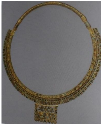
تصویر ۱۵. گردنبندی که نمای کهنیک آن نیز به دوره هخامنشی نمی‌ماند

واقعیت این است که فنجان زرین «خریداری شده» موزه تمدن‌ها (که نه به اندازه و شکل فنجان، نه به اندازه و شکل کاسه، نه هرگز یادآور شکل کلک‌های قدیمی (dhow)، نه دارای نمونه (حتی تقریبی) در چین، بلکه ترکیبی از هنر و تکنیک هنری چند گانه بسیار مبتدیانه می‌باشد) ادامه همان مسیر «تحریف آثار کهنیک فرهنگی ایران به منظور کسب درآمد» است. این موضوع یعنی تحریف، تحقیر، تخریب، کپی‌سازی، کسب درآمد از راه موزه‌های نوپای ثروتمند، و البته پیشینه‌سازی و تاریخ‌نگاری برای بیگانگان به یاری میراث فرهنگی ایران زمین (اصل و غیر اصل) به سالیان دورتر برمی‌گردد. این تازش بر پیکر زخمی میراث گرانبهای فرهنگی ایران، همان زنگ خطری است که برای آیندگان ما از غرب تا به سنگاپور و کشورهای عربی به صدا درآمده است. آنچه بر میراث فاخر ایران زمین در این سال‌ها و البته از بی‌خبری و بی‌مدیریتی داخلی جاری است، ناشی از تهیگی این کهن‌دیوار از بزرگ‌مردان ملی چون دکتر نگهبان‌ها و دکتر خانلری‌ها است. آیا تصور چنین رخدادی برای میراث کشور ترکیه هم شدنی است؟