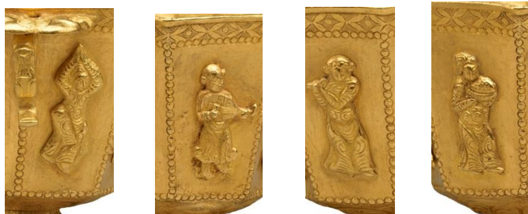
۴. نقش رقصنده ۵: عودنواز با مدل موی عجیب ۶-۷. نی نواز (بامبو) و بعدی سازی بی پیوند

کتاب «گنجینه (دانشنامه) ی موسیقی «دون هوانگ» (به چینی)، ترکیب هنری فنجان، نه تنها به خیال پردازی می ماند که در نگاره های دسته جمعی موسیقایی نیز به چنین رقصی (Treasury of Dunhuang Musical Heritages, 2002: 018, 055, 100, passim) با چنین پوششی نمی توان ارجاع داد. دون هوانگ بزرگترین محوطه - موزه جهان در نمایش میراث مشترک ایرانی - چینی به ویژه برای «میراث موسیقایی» چین ارزیابی شده است.