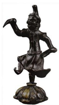
تصویر ۱۳. رقص دوره تان

دو دیگر، فاجعه در طراحی لباس نوازندگان فنجان فریاد «جعلی بزرگ» دارد. جعل کنندگان با یاری از لباس برخی «رقصندگان آکروباتیک» گورگه‌های چینی و نمادهای هنری غرب آسیا، به‌ویژه میراث ایرانی چون برخی سازها، چگونگی نگه‌داری آن‌ها و موقعیت هر نگاره، دومین گام بلند اشتباه را برداشته‌اند. نگارنده، نگاره رقص زیر (Silk Road, 2010: 117)، برجای مانده از دروازه ورودی یک گور دوره تانگ را با خوانندگان به اشتراک (تصویر ۱۴) می‌گذرد؛ آیا نقوش لباس این رقص همان نیست که دقیقاً بر تن آن هشت نوازنده پوشانده‌اند؟ با وجود این، برخی عناصر هنری این رقص، چون کلاه و سربند و دیگر آرایه‌ها... در فنجان حذف شده است. خوشبختانه در «دون‌هوانگ»، (قس. غار وضعیت بودا در حالت خواب یا نزار) با مجموعه‌ای از لباس‌های رنگارنگ گروه‌های چینی-آسیای میانه (ایرانیان) تا به غارهای افراسیاب (ازبکستان) ... روبه‌رو هستیم. آیا سازندگان با این میراث‌های مشترک ایرانی چینی نا آشنا بوده‌اند؟