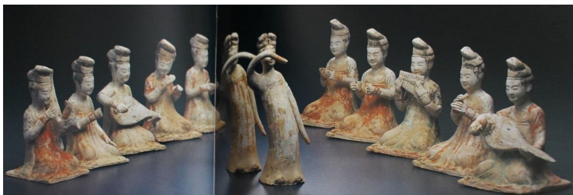
تصویر ۳. مسیر نگاه، پوشش، مو، ساز، هماهنگی نوازندگان، رقص در یک اثر اصیل

افزون‌تر، نگاره نوازندگان «موزه میهو» (Miho Museum, 1997: 260) (دوره تانگ؛ تصویر ۳) شامل دوازده نوازنده-رقاص در نقطه مقابل هنری زرنگاره موزه آسیایی قرار دارد.