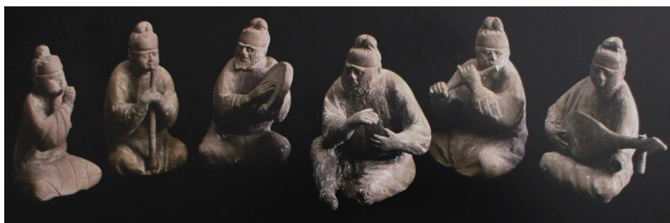
تصویر ۱۲. نوازندگان یک‌دست و هماهنگ دوره تانگ

در میراث ساسانی و یا ملهم از آن نیز در مرزهای غربی، دقیقاً این ساختار هنری و تکنیک مرواریدنشان به فراوانی اما با دقت بسی بالا دیده شده است. این میراث خواه ایرانی(چون مانوی-سغدی) خواه ترکیب ایرانی-چینی، بسی یک‌دست و زیبا دیده شده است (Les Sassanids, 2006: passim). در نگاره زیر، گروهی از نوازندگان دوره تانگ(شش نفر؛ تصویر ۱۲) با اندازه و یک‌دستگی دقیق نگاریده شده‌اند که خوانندگان به خوبی تفاوت این هنر ناب (Silk Road, 2010: 124) و آن هنر لرزان‌ترین(فنجان) را درک خواهند کرد.