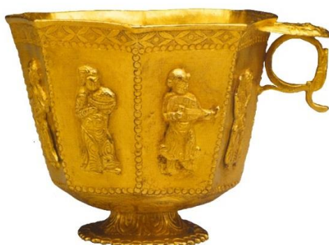
تصویر ۱. فنجان زرین پایه‌دار هشت گوشه موزه تمدن‌های آسیایی سنگاپور

زرین را خریداری و به موزه تمدن‌های آسیایی سنگاپور پیشکش کرد. برای اصالت و ارزیابی آن، از موزه «اسمیت‌سونیون» (امریکا) کمک گرفته شد؛ آن موزه نیز اصالت این اثر باستان‌شناختی را گواهی کرد...»