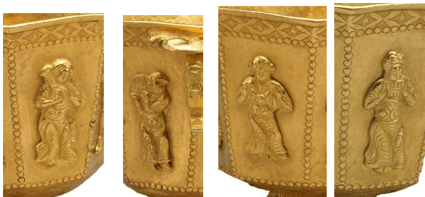
۸. نی لبک نواز ۹. طبل نوازی با طبل عجیب ۱۰. ساز دهنی نواز ۱۱. سازی بی پیوند به دیگر سازها

یکی دیگر از نوازندگان (تصویر ۹) گویی نوعی تبالا (طبلک) بر گردن دارد. این ساز بیش تر به ساز هندی همانند و هندیان بدان استاد بوده و هستند. آنچه در تارنمای موزه متروپلیتن آنلاین است، با این یکی تفاوتی فاحش ترین دارد. یافتن چنین ساز گردن آویز آن هم در کنار این شمار ساز در هنر تانگ، در دون هوانگ بسی سخت است؛ این ساز به شکل بسیار غیر حرفه‌ای و به دور از استانداردهای هنری بنابر تعریف میراث دون هوانگ در اینجا نگاریده شده است. دو طرف برآمده به سوی بالا، کوتاه بودن گردن میان آن، کم ترین گواه غیر حرفه‌ای بودن آن است؛ بدین موضوع باید شیوه کنترل ساز و نواخت آن و مسیر نگاه نوازنده را هم افزود.