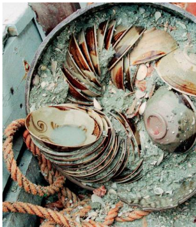
تصویر ۲. کشف آثار (Flecker, 2010: 104)

عکس‌های دقیق لحظه کشف آثار در عمق آب، چگونگی نشست ماسه بر آن‌ها، بقایای اندک کشتی، کوزه‌هایی که بخشی از آثار از آن‌ها در زیر آب به دست آمده، شدت آسیب‌دیدگی آثار، تنوع آثار زیر آب و تجزیه برخی (تصویر شماره ۲) بخشی از این ادعا است. جالب است که در انتهای داستان «راستان» کشف آن گنجینه چینی‌ها، قصه «ساختگی» این فنجان زرین (که جایی در آن عکس‌ها ندارد) نیز بدان گره خورده است.