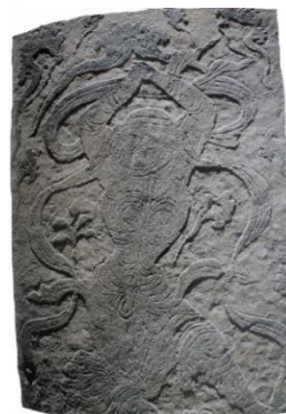
تصویر ۱۴. رقص آکروباتیک

سدیگر، موقعیت هر نوازنده بر پایه نوع سازی که در دست دارد، با دیوارک رشته مروارید معروف ریشه‌دار در هنر ناب ساسانی به نقش کناری خود بی‌پیوند و به هنر ساسانی-تانگ