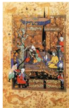
گرجستانی ۹۸۷ هـ. ق.

قلم‌گیری و صورت‌سازی و تزئینات، ترکیب‌بندی متعادل و متقارن و سکون. نمایشی از فرم (شمایل‌نگاری) و پیکره فیگوراتیو که حسی از غرور و جسارت خط در آن دیده می‌شود. اندام باریک، بلند و