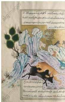
۱۰۰۲ ه.ق، انوار سهیلی. موزه آقاخان. زنو

و... گرشاسب‌نامه اسدی طوسی که یک نسخه حماسی و رزمی است. هفت اورنگ جامی که در زمان ابراهیم میرزا کتاب‌آرایی