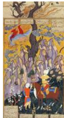
سام به لانه سیمرغ و به نزد زال می‌رسد. صادق‌بیک افشار، ۹۸۴ ه.ق. شاهنامه شاه اسماعیل دوم. موزه رضا عباسی داستان شیر و گاو. صادق‌بیک افشار.