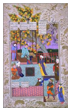
نپذیرفتن فریدون فرستادگان سلم و تور را، آقازا، ۹۹۶ ه.ق. شاهنامه شاه‌عباس. کتابخانه چستریتی، دویلین

است. حبیب‌السیور در خصوص پیامبران و ائمه اطهار و اخلاقیات. انوار سهیلی که داستان‌های کلیه و دمنه به زبان ساده توسط کاشفی نوشته شده و تصویری سازی شده است.