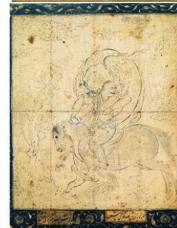
طراحی مرکبی، سیاوش بیک