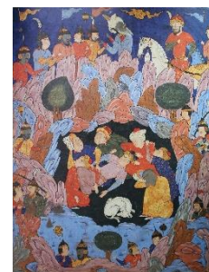
داستان اصحاب کهف، آقامیرک و