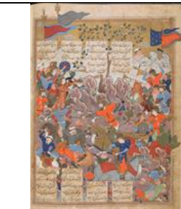
جنگ نریمان با خاقان چین، میرزین‌العابدین ۹۸۰ هـ. ق. گرشاسب‌نامه اسدی طوسی. موزه بریتانیا، لندن