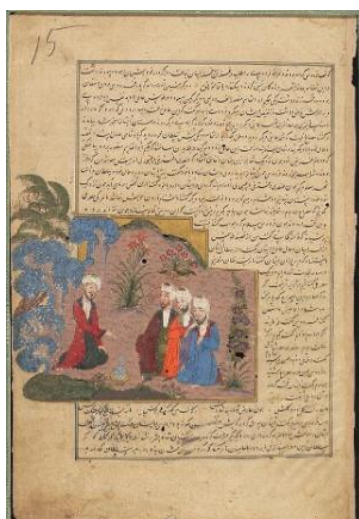
تصویر ۶. نگاره دیدار فردوسی و شعرای غزنه، شاهنامه ابراهیم سلطان، fols 15a، سده ۹ ق، شیراز، کتابخانه بادلیان آکسفورد، شماره MS. Ouseley Add. 176 (URL1)