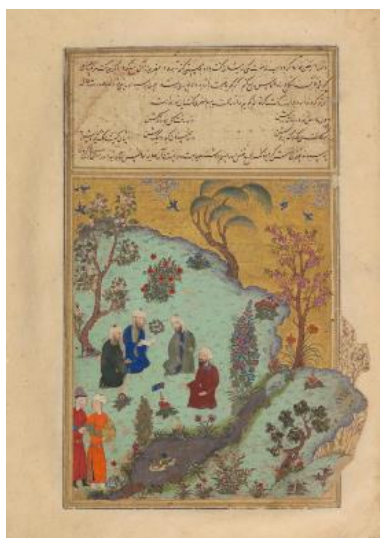
تصویر ۷. شاهنامه محمد جوکی، فردوسی و شعرای غزنه، Page 7r، کتابخانه دانشگاه کمبریج (URL2) Shāhnāmāh (MS RAS 239)

این نسخه فاقد پیرامتن دیداری است و با نگاره دیدار فردوسی و شعرای غزنه آغاز می‌گردد (تصویر ۷). این متن دارای دو نظام نشانگان دیداری و متن است. در نظام نشانگان دیداری تصویر ۶ انسان مشاهده می‌گردد که در قیاس با همین تصویر در شاهنامه بایسنقری، جایگاه دو پیکره بالا به پایین و افرادی که در حال مباحثه هستند، به بالا منتقل شده‌اند. در این نگاره بر خلاف دو شاهنامه بایسنقری و ابراهیم‌سلطان جدایی میان مباحثه‌کنندگان وجود ندارد. متن کلامی فضای بالای تصویر را به خود اختصاص داده است.