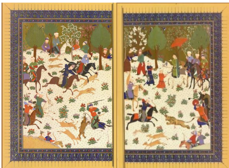
تصویر ۱. شاهنامه باسنقری ۸۳۳ هـ.ق، شکارگاه، کاخ گلستان، تهران. (فردوسی، ۱۳۵۰: ۳)

نگاره دیگر که جزو پیرامتن محسوب نمی‌شود، ولیکن به دلیل عدم پیرامتن در شاهنامه محمد جوکی و آغاز شاهنامه با تصویر شعرای غزنه به آن پرداخته می‌شود، نگاره فردوسی و شعراست که از دو نظام نشانه‌ای تشکیل شده است و متن کلامی با توجه به رنگ طلایی از ارزش دیداری بالایی برخوردار است (تصویر ۲). در متن دیداری تصویر، رودی در پایین افراد را جدا و تقسیم‌بندی کرده است و از نظر سلسله‌مراتب دو فرد عادی یا دو غلام جوان در جایگاه بالاتری قرار گرفته‌اند. در این تصویر علی‌رغم حضور انسان‌ها در فضای سبز و خرم اثری از پرنده دیده نمی‌شود.