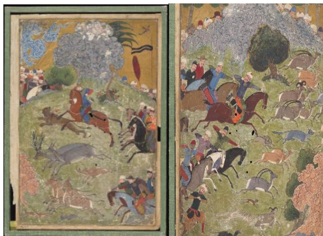
تصویر ۴. نگاره شکار رفتن ابراهیم سلطان، شاهنامه ابراهیم سلطان، fols. 2a & 3b، سده ۹ ق، شیراز، کتابخانه بادلیان آکسفورد، شماره MS.Ouseley Add. 176 (URL1)