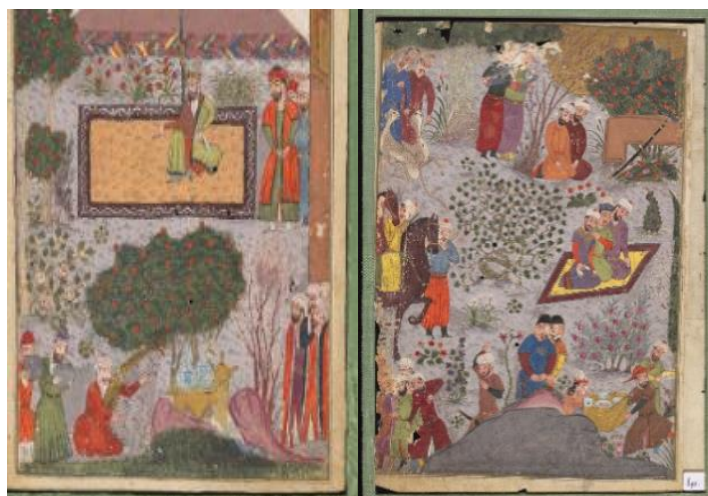
تصویر ۳. نگاره بارگاه ابراهیم سلطان، شاهنامه ابراهیم سلطان، fols. 4a & 1b، سده ۹ ق، شیراز، کتابخانه بادلیان آکسفورد، شماره MS.Ouseley Add. 176 (URL1)