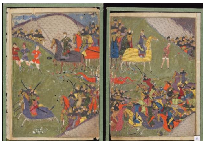
تصویر ۵. نگاره نبرد ابراهیم سلطان، شاهنامه ابراهیم سلطان، fols. 6a & 7b ۲۷۵ × ۱۸۴، میلادی، سده ۹ ق، شیراز، کتابخانه بادلیان آکسفورد، شماره MS.Ouseley Add. 176 (URL1)